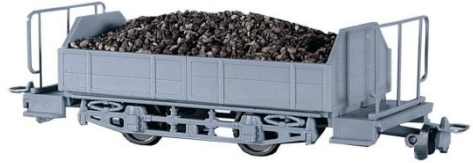
217 20 140 H0 Erdschotter 217 22 140 H0m