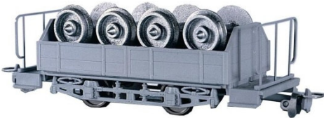
217 20 400 H0 4 Achsen 217 22 400 H0m