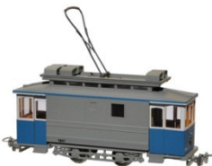
Xe 2/2 1947

Passende Triebwagen aus dem NAVEMO-Sortiment: