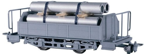
217 20 500 H0 5 Aluminiumröhren 217 22 500 H0m