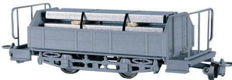
217 20 530 H0 Vierkantprofile 217 22 530 H0m