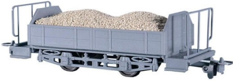
217 20 110 H0 Sand 217 22 110 H0m