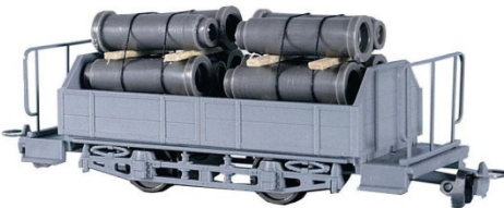
217 20 510 H0 Betonröhren 217 22 510 H0m