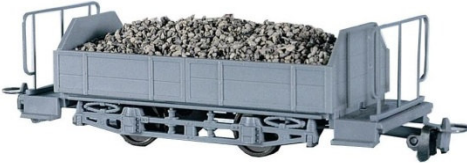
217 20 130 H0 Schotter 217 22 130 H0m