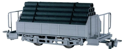
217 20 520 H0 Kunststoffröhren 217 22 520 H0m