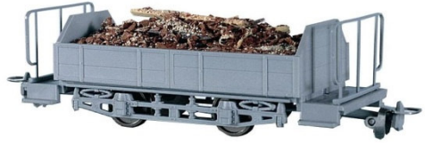
217 20 120 H0 Bauschutt 217 22 120 H0m